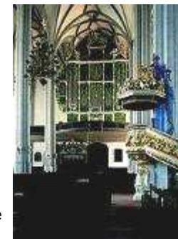
Peterskirche mit der Sonnenorgel von E. Casparini

Die gemeinsam verbrachten Abende trugen zum gegenseitigen Kennenlernen bei. Wir freuen uns schon auf die nächste Fahrt.