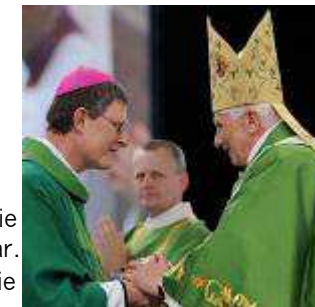
Erzbischof Dr. Rainer Maria Woelki

Auch insofern nehme ich die Auszeichnung nicht nur für mich an. Die Kardinalswürde bedeutet für einen Bischof auch Verantwortung, ja manchmal sogar Last. Deshalb bitte ich alle, mir diese Last zu erleichtern und mich in der Verantwortung für Kirche und Glauben in Berlin zu unterstützen.